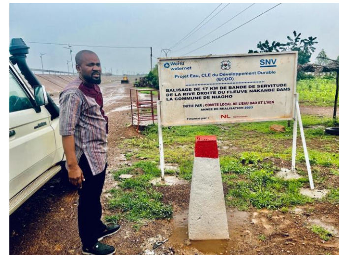
Suivi-supervision des travaux de delimitation par le directeur regional en charge de l'eau du Centre-Est