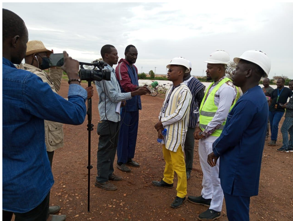
Visite de la réalisation des balises par les autorités provinciales du Boulgou organisée par la DREA avec la Rtb2