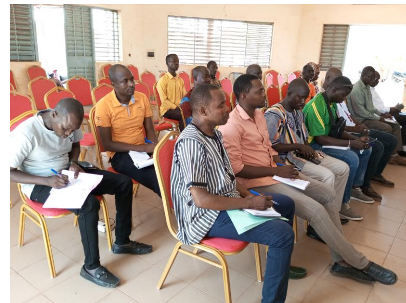
Rencontre d'information avec les forces vives de Niaogho