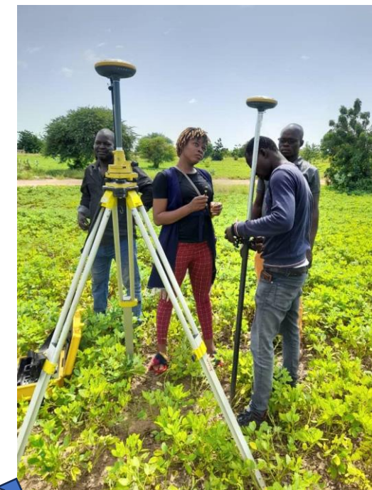
Levé topo des périmètres maraichers