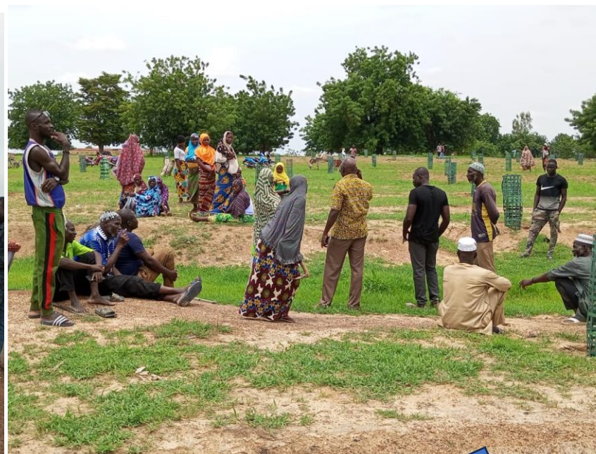
Plantation d'arbres avec une forte mobilisation des femmes